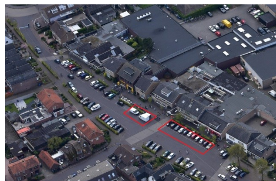
De Meent Odijk