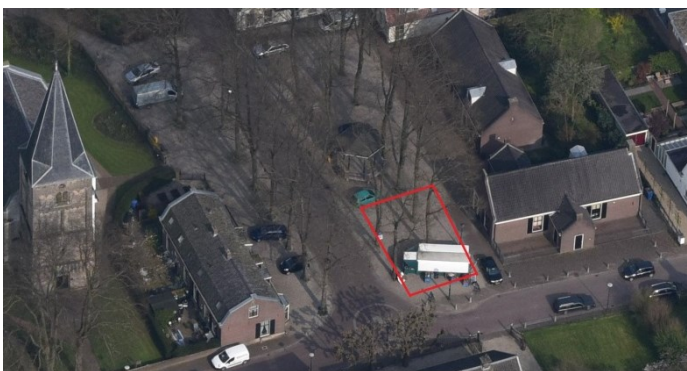
De Brink Werkhoven