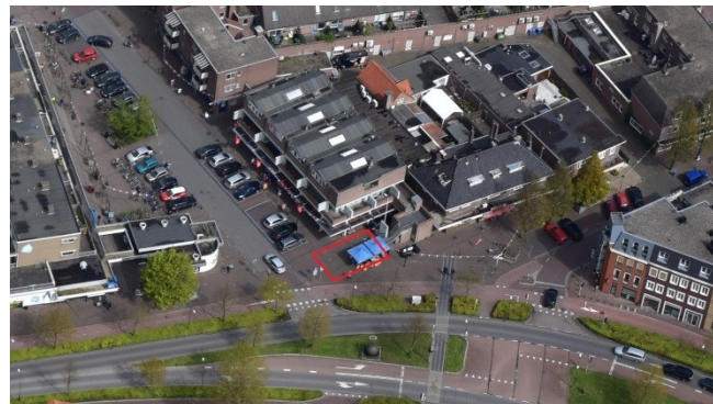
Van Hardenbroeklaan Bunnik