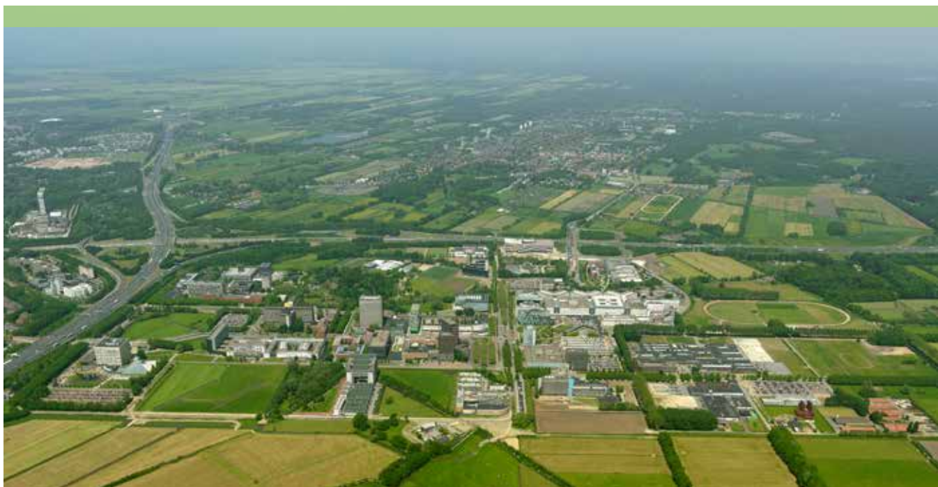
"Luchtfoto Utrecht Science Park, gezien vanuit Bunnik."

De nieuwe burgemeester wil investeren in het voorzitterschap van het college en ziet de vergaderingen niet als een routinematige activiteit. Het voorzitterschap van het dagelijkse bestuur van de gemeente is een intensieve en essentiële taak. Hij is een constructief voorzitter van een collegiaal bestuur en bouwt samen met de collegeleden aan de stabiliteit, continuïteit en effectiviteit van het team. Hij zorgt er voor dat binnen het college ruimte is voor het uitwisselen van argumenten en het voeren van het goede en juiste gesprek. Hij brengt de (inhoudelijke) discussie verder en steekt zijn energie in een kwalitatief goed en gedragen besluit. De burgemeester heeft oprechte belangstelling voor de andere collegeleden en werkt intensief, constructief en rolvast samen met de gemeentesecretaris. Hij krijgt naast de wettelijke portefeuilles ook een beperkt aantal eigen portefeuilles. Welke dat zijn, wordt later in het college afgestemd.