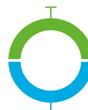
niet tijdig afgehandeld