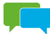
Helder, leesbaar en goed onderbouwd